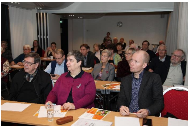
NSK-seminarium om e-hälsa och om pensioner