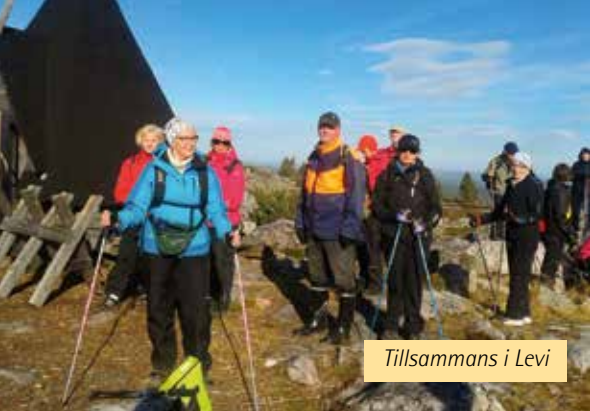
Tillsammans i Levi