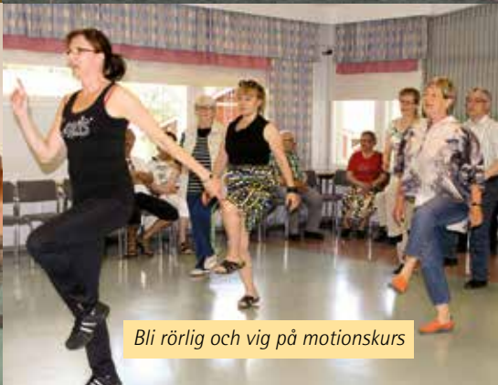
Bli rörlig och vig på motionskurs