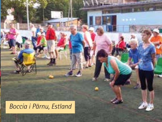
Boccia i Pärnu, Estland