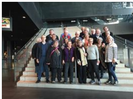
Nordiska samarbetskommittén i Harpa, Reykjavik

EU – det talas i debatten om ett direktiv om minimilöner. Erfarenheterna säger att detta skulle pressa lönerna nedåt.